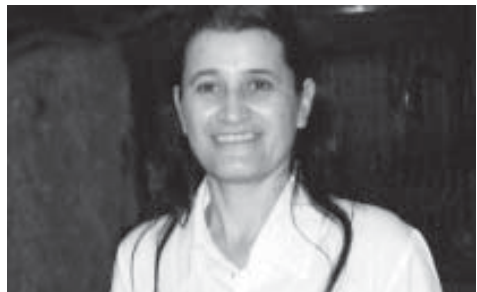
Deputada se destaca na luta por solução para o endividamento

Após longas negociações e grande expectativa por parte dos produtores rurais, o Governo Federal, através do Banco Central do Brasil, publicou a Resolução nº 3.563, de 24 de abril, implementando o primeiro ato oficial do pacote de renegociações das dívidas do setor rural. A norma autoriza prazos adicionais para pagamento de operações de investimento e custeio.