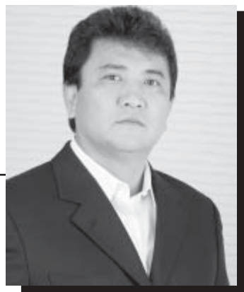
Walter Horita Presidente da Aiba

S e o período que vai de dezembro até o carnaval já costuma ser confuso e atropelado, em anos de crise, isso fica ainda pior. À correria dos fechamentos de balanço, dos calendários interrompidos pelas dezenas de confraternizações, das compras, das festas e férias, soma-se a incerteza, que invalida os planejamentos e distorce cenários, nos obrigando a pisar mais fundo, não no acelerador, mas no freio.