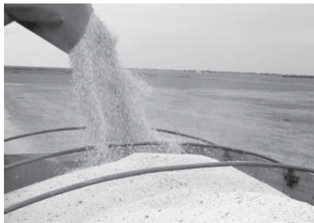
Agronegócio gerou sozinho U$ 200 bilhões em reservas para o país

Esta edição especial do Informaiba traz uma síntese dos trabalhos da Abapa, Aiba, Fundação Bahia e Fundeagro em 2008. Veja ainda notícia sobre as primeiras ocorrências de ferrugem asiática nesta safra e as ações imediatas do Programa Estratégico de Manejo da Ferrugem Asiática da Soja no Oeste da Bahia. Boa leitura!